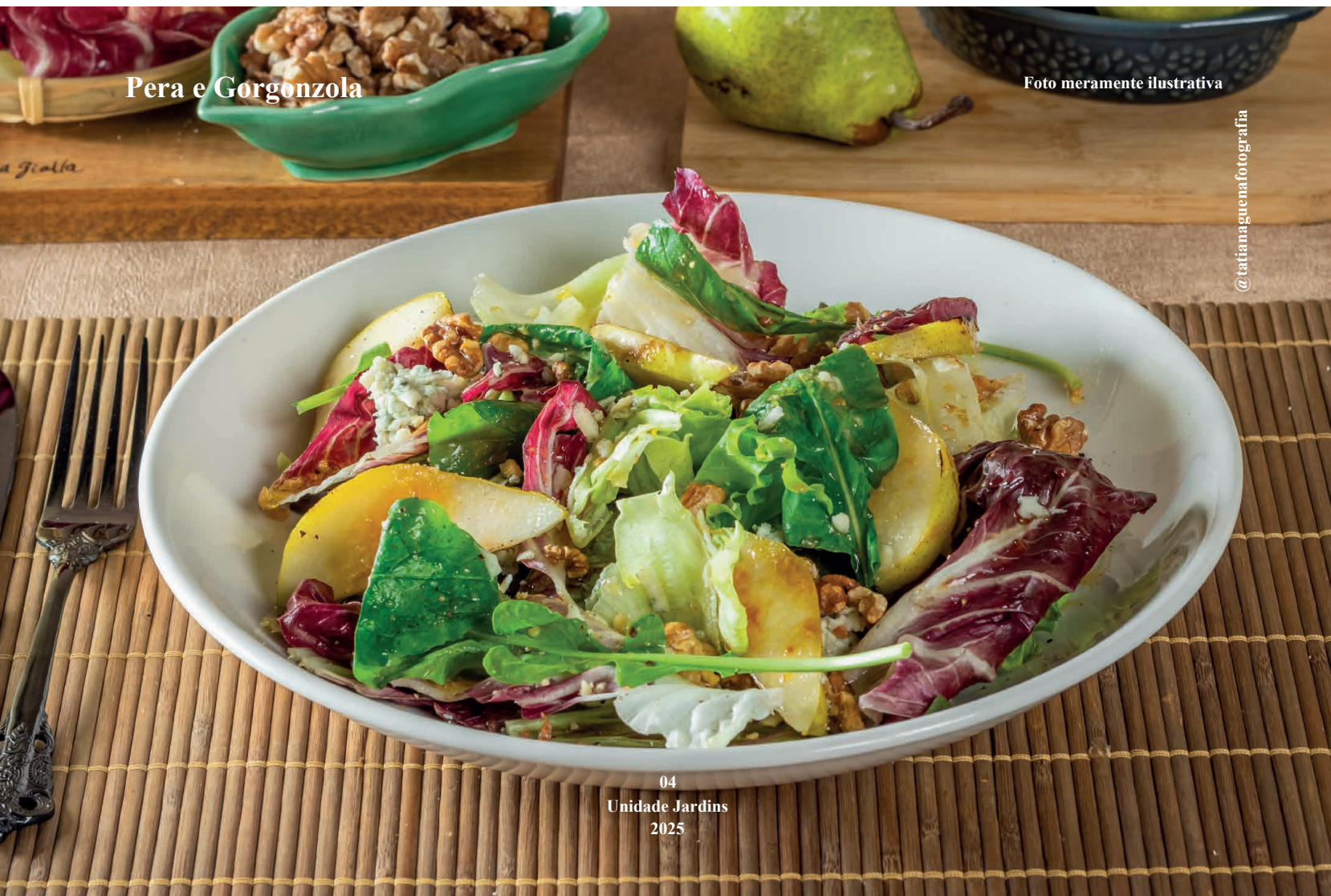
Pera e Gorgonzola

Salada com presunto cru, brusquetinhas de queijo brie gratinado e figo ao vinagrete de amora Salad with raw ham, gratin brie cheese bruschette and fig in blackberry vinaigrette