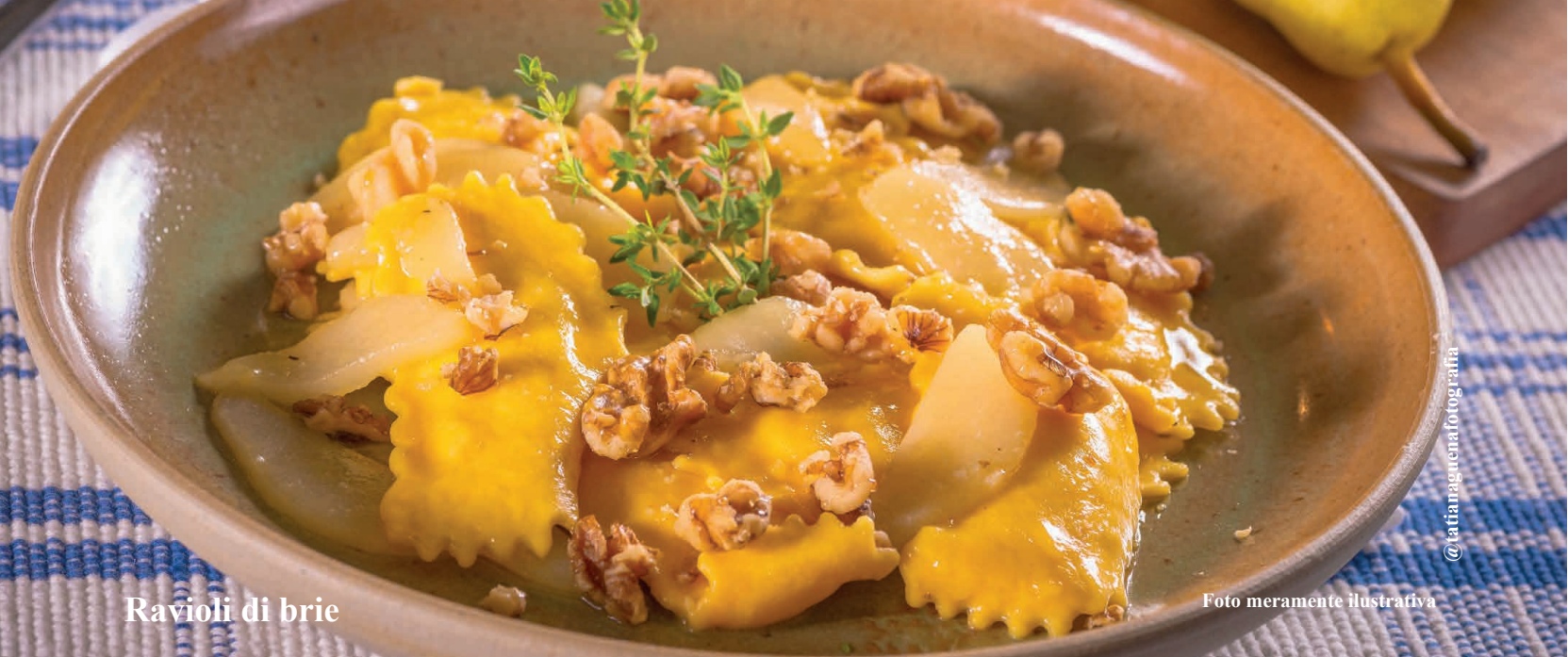
Ravioli di brie