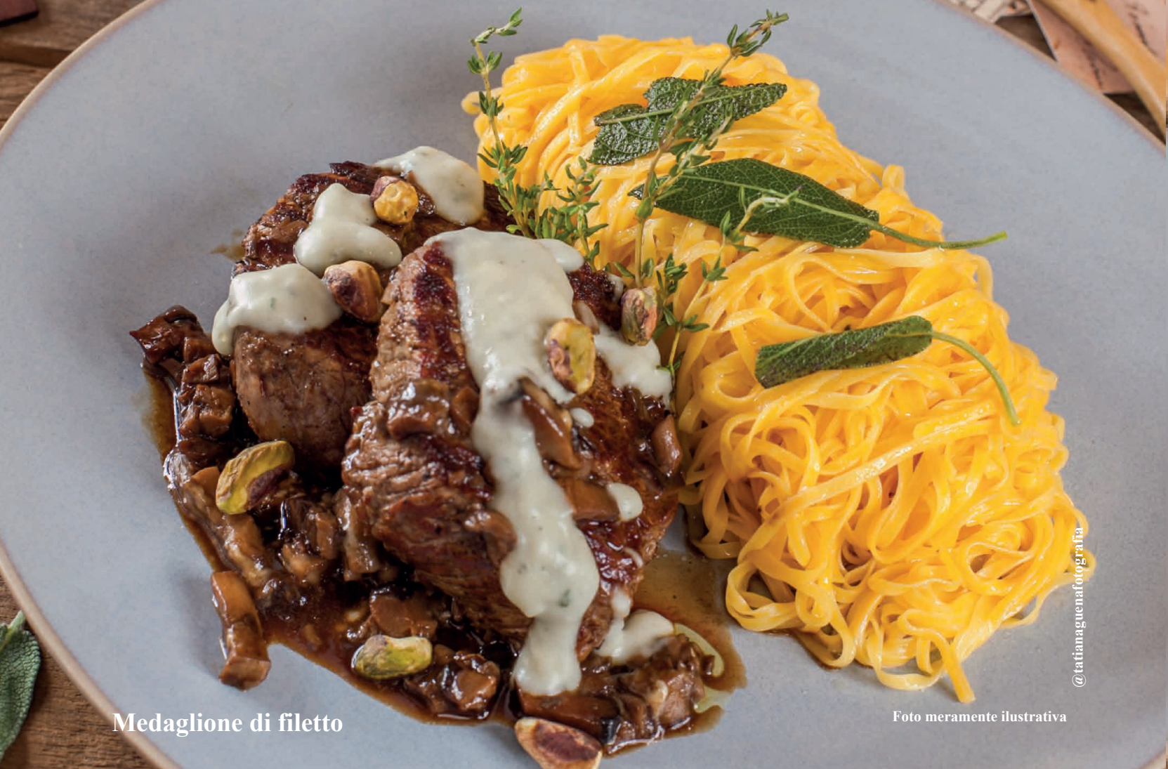
Medaglione di filetto