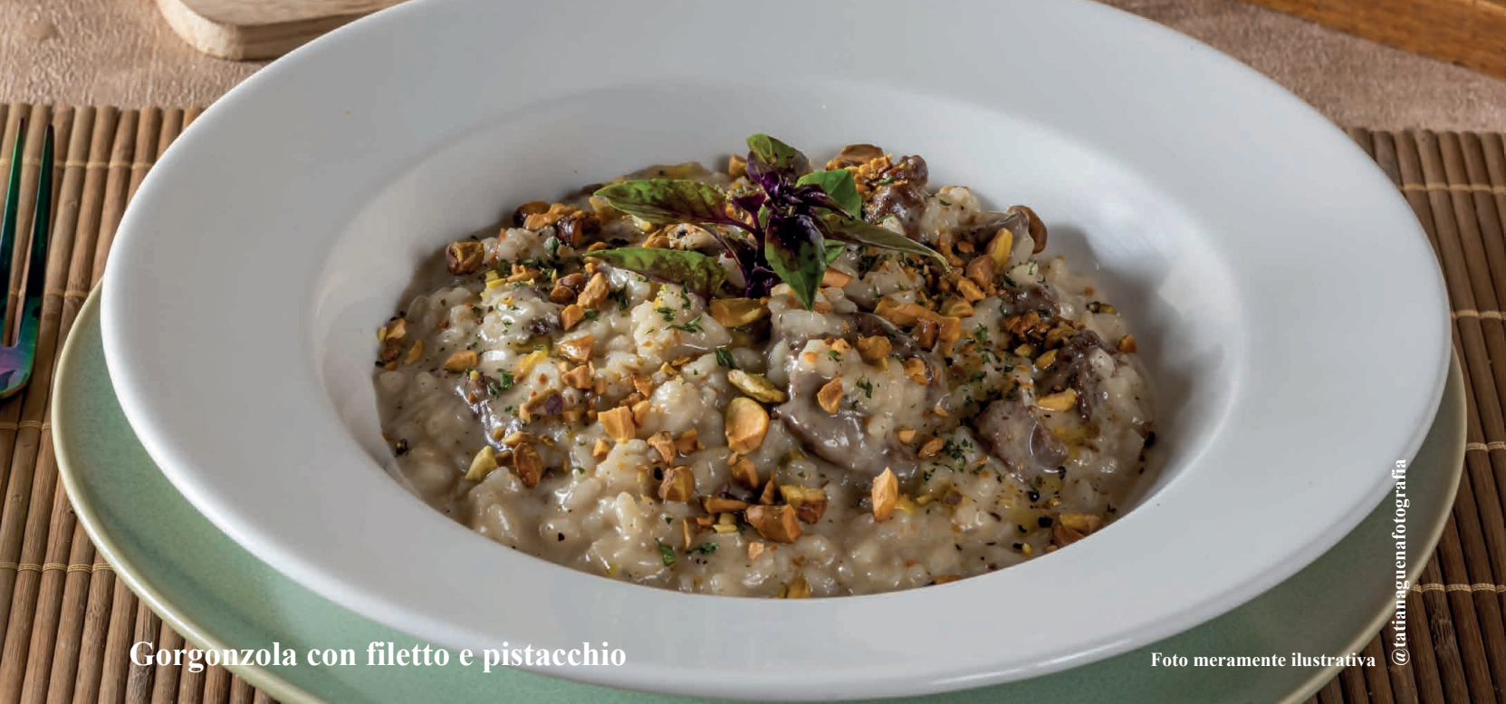
Gorgonzola con filetto e pistacchio